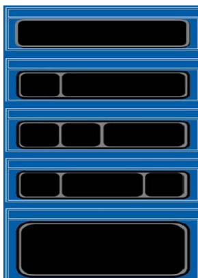
Različne oblike SPIS v EU

Uvajanje inteligentnih transportnih sistemov v EU, financiranih in vodenih v sklopu programa EASYWAY, vključuje tudi več različnih evropskih študij (ES-European Studies), med njimi ES 4: Mare Nostrum, katere aktivni člani smo. ES 4 ima nalogo usklajevanja in harmoniziranja prometnih vsebin spremenljive prometno informativne signalizacije (SPIS) na evropskih avtocestah, kjer se uporabljajo različne oblike te signalizacije: