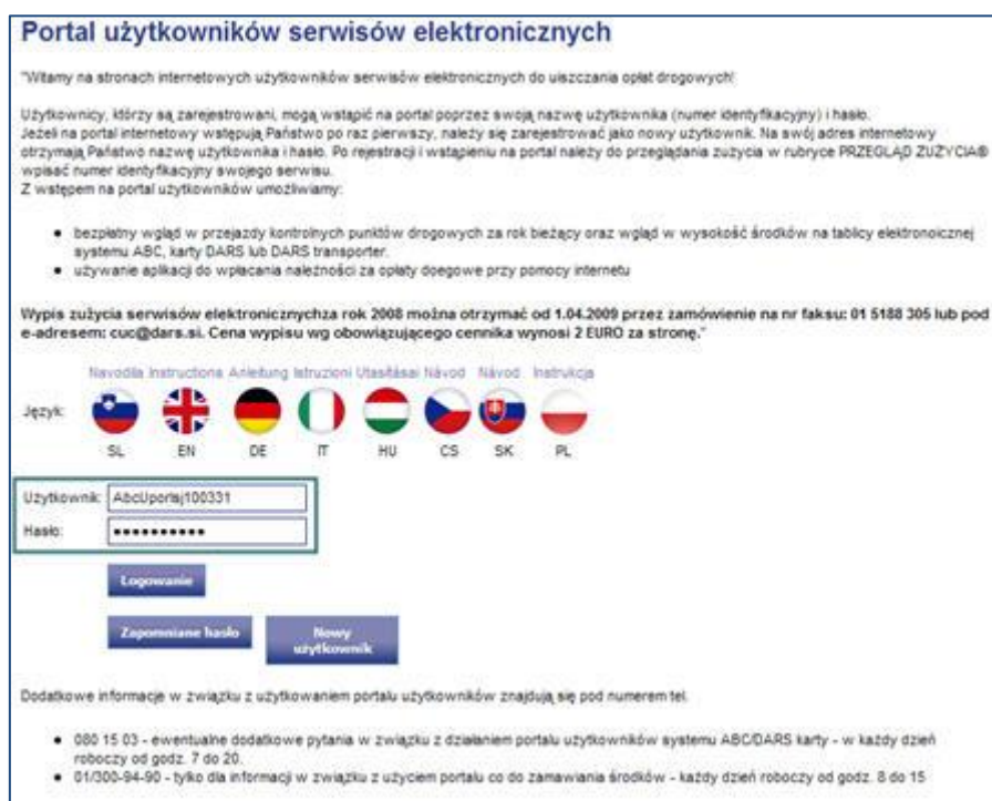
Rys. 3 Wejście do programu

2.3. Nazwę użytkownika i hasło należy wpisać w takiej formie, w jakiej zostały one przesłane pocztą elektroniczną (należy zwrócić uwagę na wielkość liter). Nazwę użytkownika i hasło należy zapamiętać (zapisać), ponieważ będą one potrzebne przy każdym wejściu na portal użytkowników serwisów elektronicznych (rys.3).