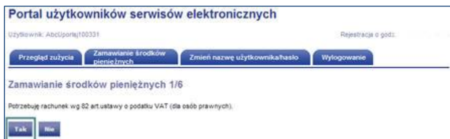
Rys. 5 Płatnicy podatku VAT

3.1. Jeżeli są Państwo płatnikami VAT (spółka z o.o., S.A.), potrzebują Państwo ofertę i rachunek zgodnie z 82 artykułem ustawy o podatku VAT. Prosimy o kliknięcie TAK (Rys. 5).