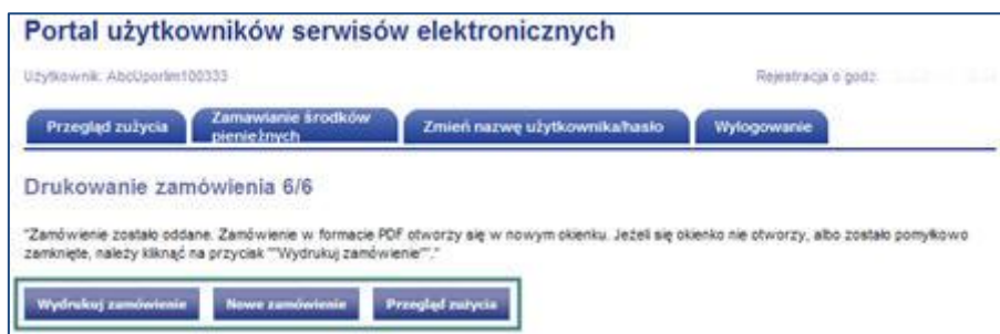
Rys.15 Drukowanie oferty w formacie pdf

Dodatkowe informacje mogą państwo otrzymać w dni robocze w godz. 8:00-15:00 pod numerem telefonu (00386) (0)1/300-94-90.