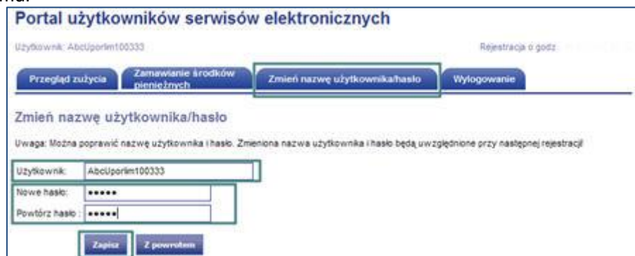
Rys. 16 Zmiana nazwy użytkownika lub hasła

Dane ulegną zmianie po kliknięciu na ZAPISZ i będą obowiązywały przy każdym kolejnym logowaniu się do systemu.