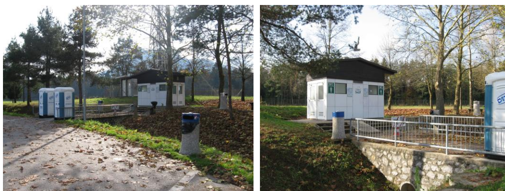
Sanitarni objekt na počivališču Povodje – zahod

Sanitarni objekt je v obeh primerih locirani na zadnjem delu počivališča. Gre za pritlični objekt dimenzij 2,40 m x 4,20 m, pregrajen v štiri sanitarne enote. Tako objekt vsebuje dve moški sanitarni enoti in dve ženski sanitarni enoti. Objekta sta opremljena z notranjo električno razsvetljavo. Sanitarni prostori v objektu niso ogrevani (zato so v zimskem času zaprti), na razpolago je le hladna voda. Umivalnik je lociran zunaj sanitarnega objekta ob dostopni poti, voda v umivalniku je v zimskem času zaprta. V objektu ni na razpolago dodatnih delavno – servisnih prostorov za potrebe čistilcev, kar je potrebno upoštevati pri pripravi ponudbe in pri načrtovanju izvedbe del. Zunanji tlakovani plato, na katerem stoji sanitarni objekt, je okvirnih dimenzij 7,00 m x 5,00 m. Dostopna asfaltirana in v nadaljevanju tlakovana pot do sanitarnega objekta je dolžine od 10 m in širine 4 m.