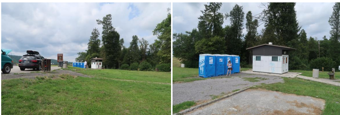
Sanitarne kabine in sanitarni objekt na počivališču Studenec – sever