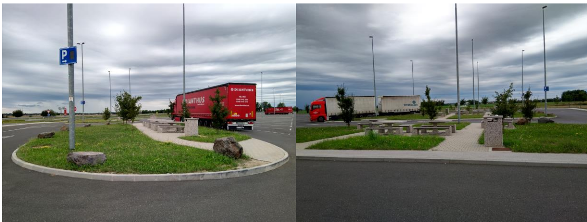
Površine za počitek in rekreacijo na počivališču Murska Sobota-S 2. faza

Predmet razpisa je oddaja storitev vsakodnevne čiščenja platoja počivališča in zelenih površin počivališča ter vsakodnevne čiščenja javnega sanitarnega objekta na počivališču Murska Sobota-sever, 2. faza.