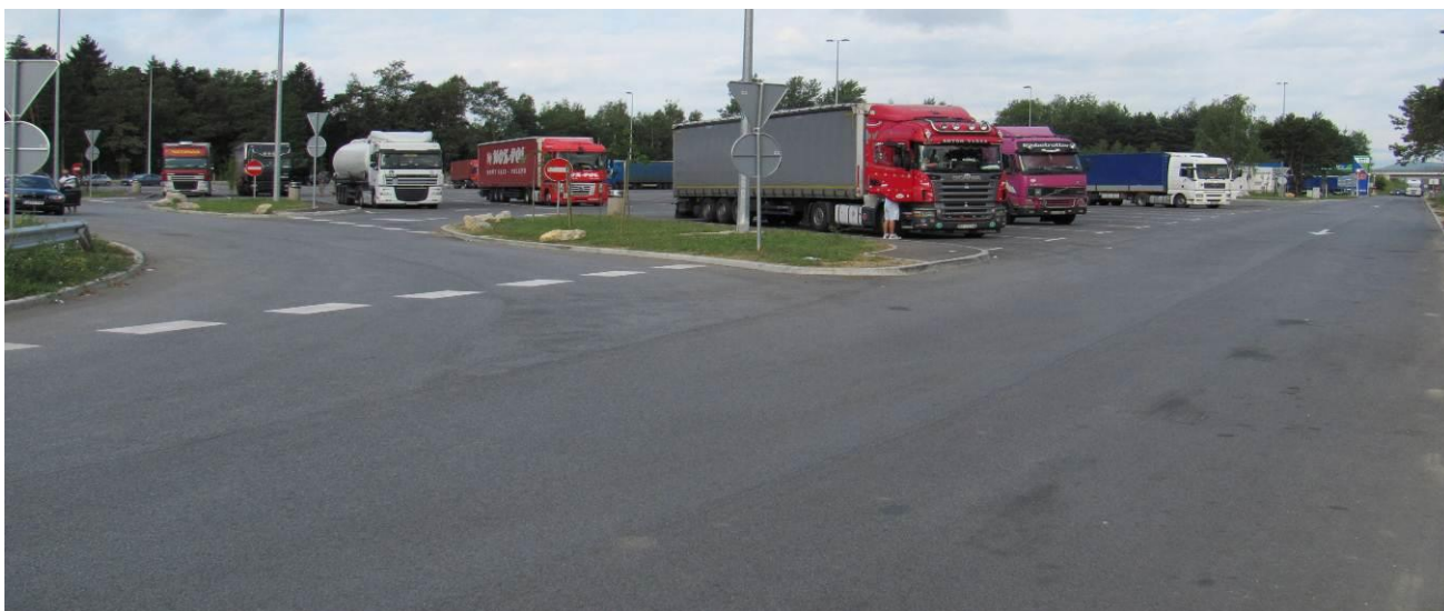
Parkirne površine na počivališču Lopata - jug

Sanitarni objekt je lociran na jugozahodnem delu počivališča. Objekt je tlorisnih dimenzij 7,25 m x 4,35 m, skupna uporabna površina objekta znaša 22,4 m 2 . Razdeljen je na moški in ženski del z ločenimi vhodi. Moški del sestavljajo predprostor površine 4,15 m 2 , opremljen s tremi umivalniki, in sanitarije površine 14,9 m 2 s štirimi ločenimi sanitarnimi kabinami, opremljenimi s počepniki, od katerih so v obratovanju le tri enote. V sanitarijah so vgrajeni tudi štirje skupni pisoarji. Ženske sanitarije obsegajo en prostor skupne površine 3,92 m, v katerem sta vgrajena WC školjka in umivalnik. Vsa notranja oprema v objektu je izdelana iz nerjaveče inox pločevine.