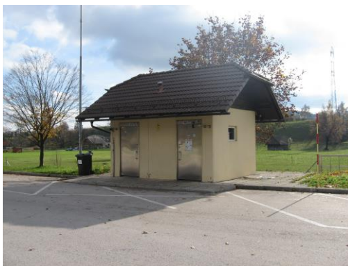
Sanitarni objekt na počivališču Lipce – sever (levo) in na počivališču Lipce – jug (desno)