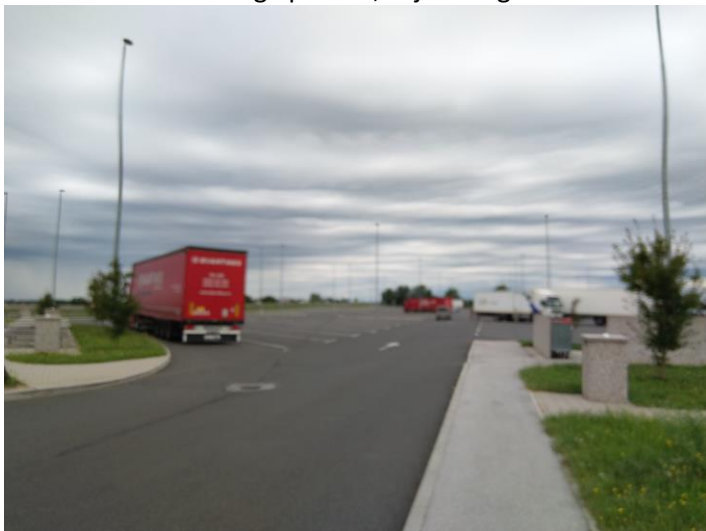
Parkirne površine na počivališču Murska Sobota-S 2. faza

površina asfaltnih površin 36.500 m 2 , zelene površine pa obsegajo 8.500 m 2 . Razporeditev površin je razvidna iz situativnega prikaza, ki je Priloga 2 teh tehničnih zahtev in pogojev.