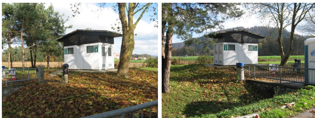
Sanitarni objekt na počivališču Povodje – vzhod