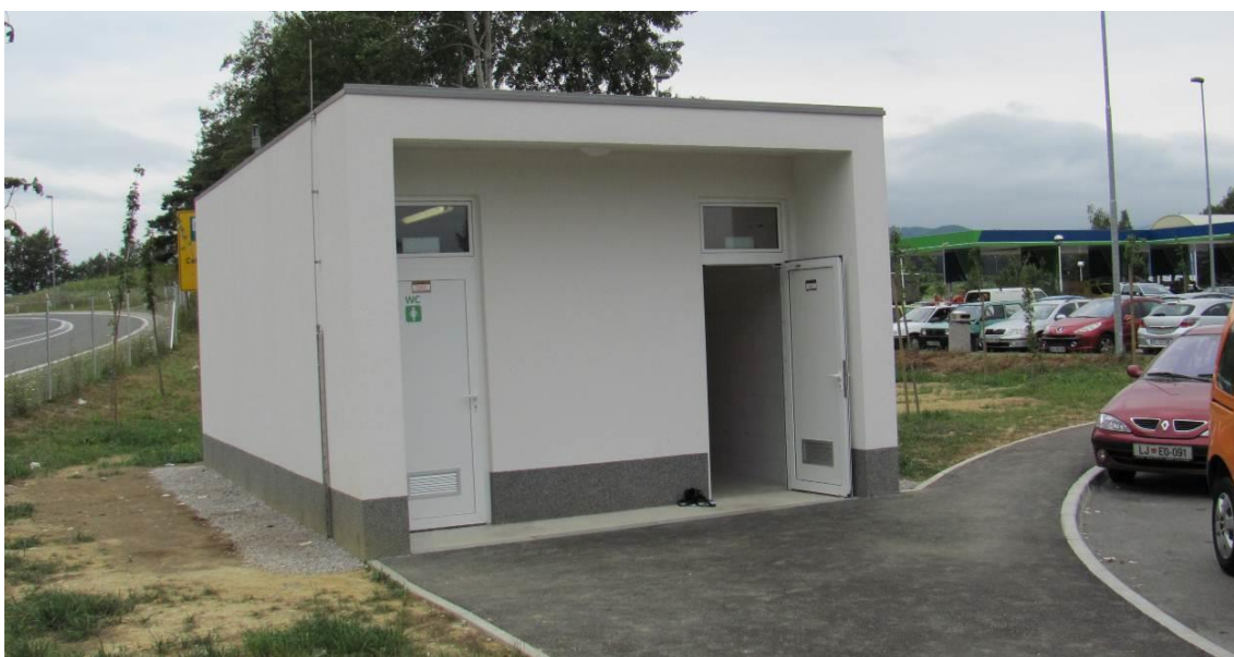
Sanitarni objekt na počivališču Lopata - jug

Objekt je opremljen z notranjo električno razsvetljavo. Sanitarni prostori v objektu so ogrevani, v vodovodnem sistemu pa je na razpolago le hladna voda. Objekt nima delavno – servisnega prostora za potrebe vzdrževalcev.