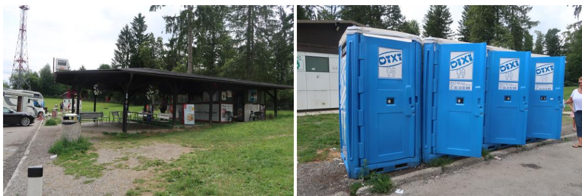
Sanitarne kabine in sanitarni objekt na počivališču Studenec – jug

Trenutno sta sanitarna objekta na prikazanih lokacijah zaradi dotrajanosti zaprta. Začasno so na vsakem počivališču nameščene štiri sanitarne enote, ki so predmet »dodatnega« čiščenja. Zaradi velike frekventnosti se dopušča možnost namestitve še dodatnih dveh sanitarnih kabin na lokacijo Studenec-jug, ki bodo tudi predmet čiščenja s tem razpisom. Sanitarne enote načeloma čisti in prazni najemodajalec 2-3 krat tedensko. S tem razpisom želimo pridobiti izvajalca dodatnega čiščenja sanitarnih kabin, ki naj bi se izvajalo 3x – 5x dnevno (glej razpored v nadaljevanju) in izvajanje čiščenja neposredne okolice okrog