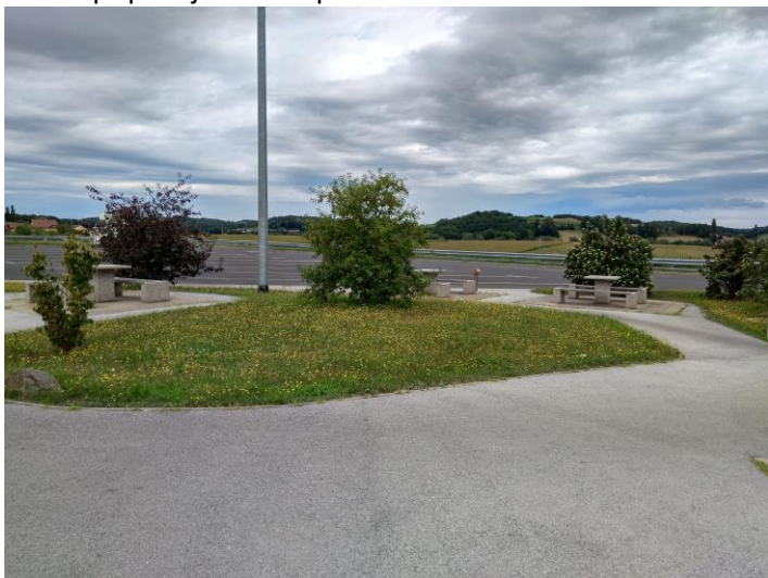
Površine za počitek in rekreacijo na počivališču Grabonoš-S 2. faza.

Površine za počitek in rekreacijo se nahajajo na platoju pred javnim sanitarnim objektom. Obsegajo štiri mize s pripadajočimi klopmi.