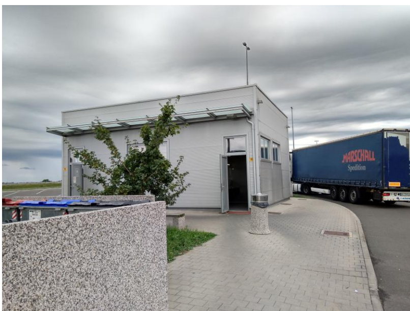
Sanitarni objekt na počivališču Murska Sobota-S 2. faza

Sanitarni objekt je lociran na vzhodnem delu počivališča. To je pritlični objekt tlorisnih dimenzij 10,40 m x 7,89 m. Razdeljen je na moške in ženske WC-je, v objektu je tudi prostor s tuš kabino in manjši prostor za čistila. Objekt je opremljen z notranjo električno razsvetljavo. Sanitarni prostori v objektu so minimalno ogrevani, na razpolago je le hladna voda. V objektu ni predviden večji delavno – servisni prostor za potrebe vzdrževalcev.