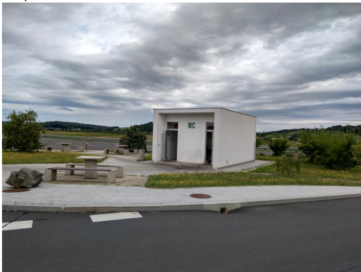
Sanitarni objekt na počivališču Grabonoš-S 2. faza.